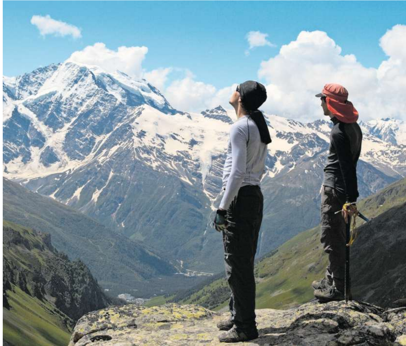
Der Weg ist das Ziel: Zwei Wanderer nehmen sich mehr vor, als einen Berggipfel zu erklimmen.

In meinem bisherigen Leben habe ich schon einige Gratwanderungen gemacht - in echt wie symbolisch. Und ich stand an vielen Wegkreuzungen, musste mich für eine Rich-